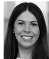
Eva-Marie Mümken Cohausz & Florack Patent- und Rechtsanwälte Düsseldorf www.cohausz-florack.de

Weitaus bessere Chancen auf anerkannten Schutz bietet in dieser Hinsicht das Markenrecht. Eine Voraussetzung dafür, dass ein Slogan als Marke akzeptiert wird, ist seine Unterscheidungskraft. Der Slogan sollte also so formuliert sein, dass Verbraucher ihn mit einem bestimmten Unternehmen in Verbindung bringen. Dabei darf er das Produkt nicht lediglich beschreiben und auch nicht nur aus einer allgemein gebräuchlichen Wortfolge bestehen. Spätestens seit dem bejahenden Urteil des Europäischen Gerichts-